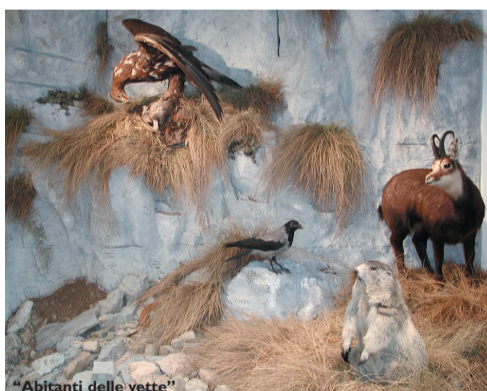
"Abitanti delle vette"