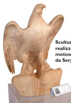
Scultura in legno realizzata con la sola motosega da Sergio Frisanco