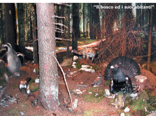
"Il bosco ed i suoi abitanti"