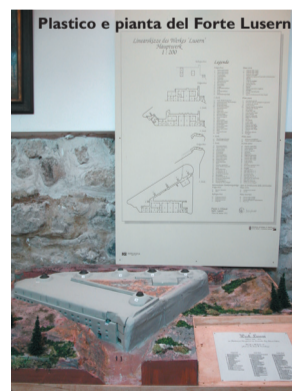
Plastico e pianta del Forte Luserna