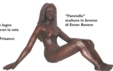
"Fanciulla" scultura in bronzo di Enver Rovere