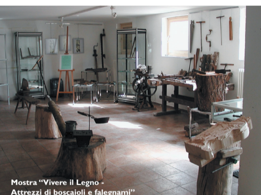
Mostra "Vivere il Legno - Attrezzi di boscaioli e falegnami"