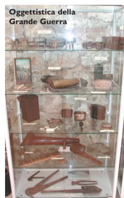
Oggettistica della Grande Guerra